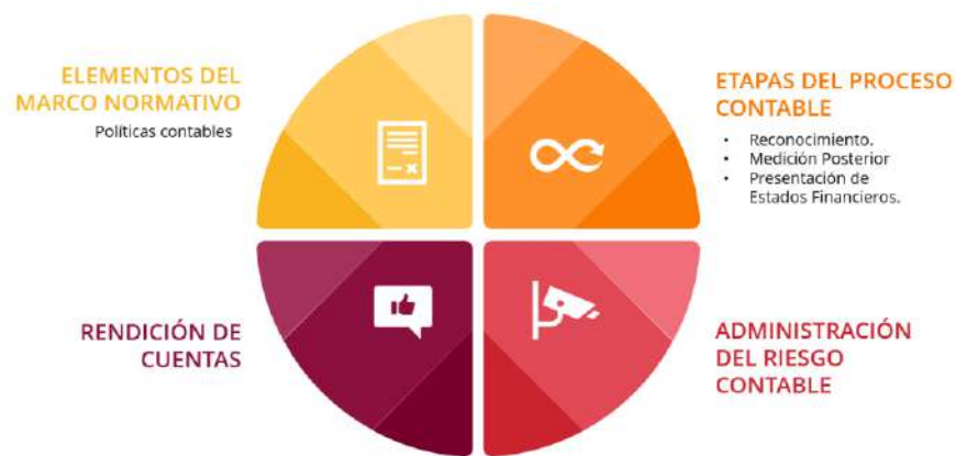
Ilustración 1. Segmentos Formulario Evaluación CIC –CGN.