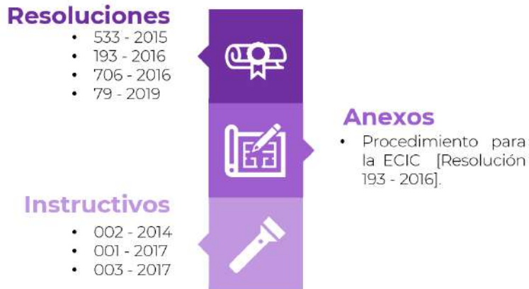
Ilustración 2. Marco Normativo Control Interno Contable.