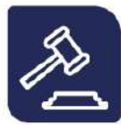
Ilustración 1. Marco Actividad Auditoría.