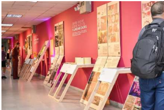
Fig. 1. Imágenes de la exposición presencial “Otras Experiencias Expandidas, 2023”.