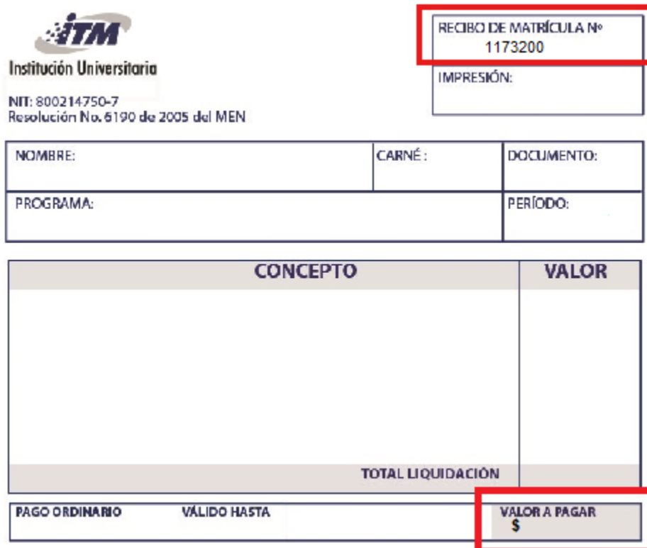
Ilustración 2: Consulta liquidación de matrícula PDF

Paso 3: Será dirigido al área de pago administrada por el banco, por favor proceda acorde a lo que la página le solicite.